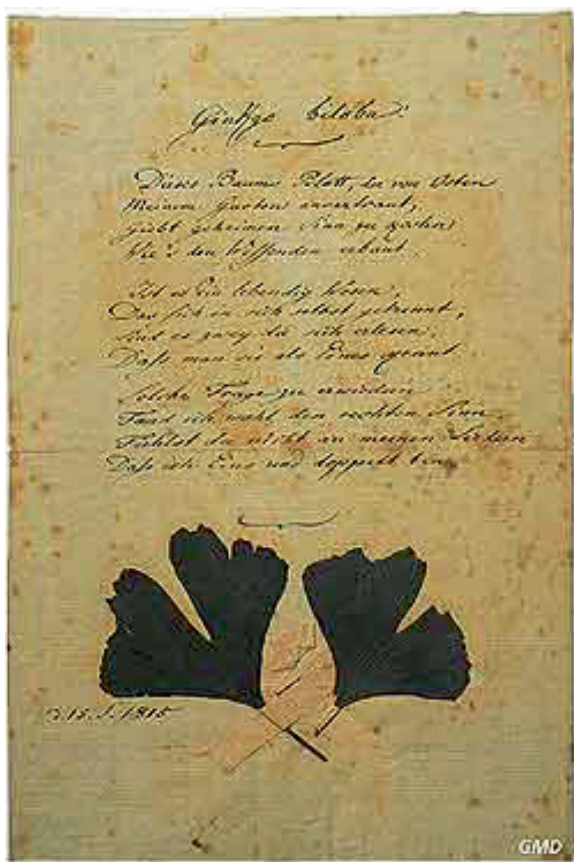
გოეთე. „გინგო ბილობას“ თეთრად ნაწერი ხელნაწერი, წარმოდგენილი ორი დატკეპნილი გინგოს ფოთლით. 1815 წლის 15 სექტემბერი.

გოეთემ წიგნად გამოსცა, რითაც ოჯახს თავისი სიკვდილის შემდეგ შემოსავლის წყარო გაუჩინა. ამავე მიზეზით 1828 წელს ხელახლა გამოსცა მან ნაწარმოებების სრული კრებული. გოეთეს ოჯახი წარმოდგენილია იოსეფ ფრიდრიხ რააბესა და ლუიზე ზაიდლერის მიერ შესრულებული ტილოებით. ბოლო ვიტრინა გოეთეს სიკვდილის თემას ეძღვნება. ლითოგრაფიაშია გადმოცემული გოეთეს ოთახი. პრელერის ნახატზე სასიკვდილო სარეცელზე გამოსახულ გოეთეს თავს დაფნის გვირგვინი უმშვენებს. ამავე ვიტრინაში დევს 1832 წლის სამუშაო გეგმა, რომლის დასრულება გოეთეს არ დასცალდა. გეგმის მოპირდაპირე მხარეს გამოფენილია გოეთესა და ეკერმანს შორის გაფორმებული ხელშეკრულება, დარჩენილი ნაწარმოებების გამოქვეყნების თაობაზე, მათ შორისაა „ფაუსტის“ მეორე ნაწილიც, რომელიც გოეთეს გარდაცვალების წელსვე, 1832-ში გამოიცა.