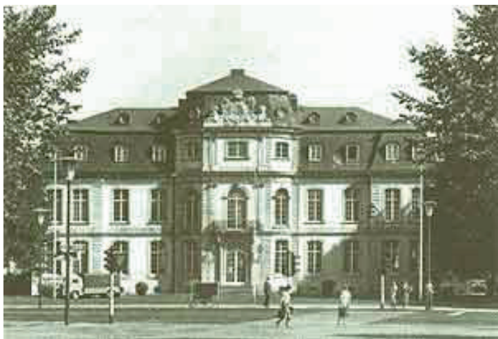
გოეთეს მუზეუმი დიუსელდორფში. ანტონ-და-კატარინა-კიპენბერგების-ფონდი. შლოს იეგერჰოფი.

ანტონ კიპენბერგმა, რომელიც 1874 წელს ბრემენში დაიბადა და 1950 წელს ლუცერნში გარდაიცვალა, მთელს მსოფლიოში გაითქვა სახელი, როგორც ლაიფციგში ინზელის გამომცემლობის ხელმძღვანელმა და მესაკუთრემ. მან, როგორც ბუკინისტმა, ახალგაზრდობაშივე დაიწო გოეთეს საგანძურების შეგროვება, რითაც იმთავითვე შექმნა ფუნდამენტი გოეთეს საცავისათვის. კიპენბერგის მიერ ნახევარი საუკუნის განმავლობაში თავმოყრილი განძის საფუძველზე მისმა ქალიშვილებმა დიუსელდორფში დამოუკიდებელი იურიდიული სტასუსის მქონე ფონდი ჩამოაყალიბეს და მშობლების პატივსაცემად ანტონ-და-კატარინა-კიპენბერგების-ფონდი უწოდეს. დიუსელდორფში ფონდის განსათავსებლად საუკეთესო ადგილი იყო სასახლე შლოს იეგერჰოფი, რომელიც საკარო ბადის აღმოსავლეთ ნაწილში მდებარეობს. 1748 წელს იეგერჰოფის მშენებლობა პფალცის თავადმა, კარლ თეოდორმა, აახენის არქიტექტორს იოჰან იოზეფ ქუვენს დაავალა, ხოლო მოგვიანებით შენობის არქიტექტურულ გეგმაში ცვლილებები საკუთარ ხუროთმოძღვარს ნიკოლა დე პიჟაჟს შეატანინა. გოეთეს დაბადებამდე ერთი წლით ადრე დაპროექტებული მშენებლობა 1772 წელს დასრულდა. გოეთემ შლოს იეგერჰოფი სავარაუდოდ დიუსელდორფში თავისი პირველი ვიზიტის დროს ნახა, თუმცა იგი არაფერს სწერს მასზე. იაკობების ოჯახის აგარაკს პემპელფორტს, სადაც გოეთე დიუსელდორფში სტუმრობდა, შლოს იეგერჰოფისგან ერთი ბაღი ჰყოფდა. 1792 წლის ნოემბერში საფრანგეთის წინააღმდეგ ომიდან დაბრუნებულმა გოეთემ ოთხი კვირა იაკობების აგარაკზე დაჰყო. ამ მოგზაურობის შესახებ გაკეთებულ ჩანაწერებში მართალია ის სასახლეს არ იხსენიებს, მაგრამ ხოტბას ასხამს მეზობლად მდებარე აყვავებულ